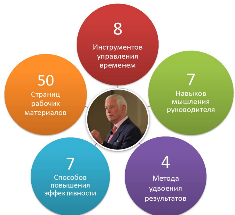
Рис. Содержание семинара в цифрах

Мы ждем Вас и членов Вашей команды на новом семинаре Брайана Трейси!